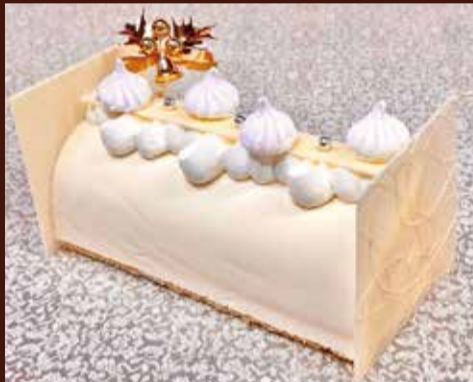
ホワイトクリスマス 軽やかな酸味とコクのプロマージュブラン、苺のムースと洋梨を組み合わせました。 長さ19cm / ¥5,950 (税込)