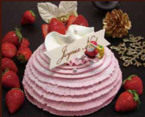
いちごのモンブラン ガリュウMの不動の人気No1商品の定番クリスマスケーキです。ピンク色の苺のクリームをドーム状に仕上げた華やかな一品です。 直径13.5cm / ¥5,400 (税込)