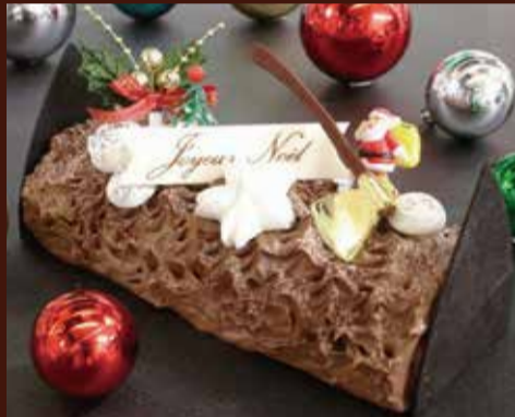
ブッシュ ショコラ チョコレートの程よい甘さとほろ苦さを兼ね備えたガリュウMのクラシカルな定番ブッシュドノエルです。 長さ19cm / ¥5,700 (税込)