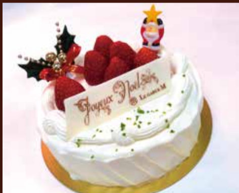
苺のショートケーキ ふんわり柔らかいスポンジと、口溶けの良い北海道産生クリームを組み合わせた定番クリスマスケーキです。 Mサイズ 直径15cm / ¥5,800 (税込) Lサイズ 直径18cm / ¥7,800 (税込)