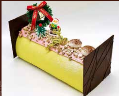
ピスターシュ フレーズ ショコラ ビスタチオの風味豊かなムースに濃厚なガナッシュショコラと酸味がアクセントのフレーズのジュレを組み合わせ。 長さ19cm / ¥5,950 (税込)