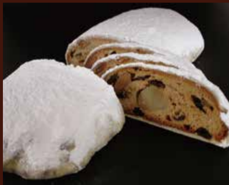
シュトーレン クリスマス定番のドライフルーツたっぷりの発酵菓子。 長さ約18cm / ¥3,500 (税込)

ご予約締切日/12月17日(火) クリスマスケーキのお受け渡し期間：12月23日～25日 プーランジェリー(パン屋)でのご予約、受け取りはお受けして ありません。ご了承ください。